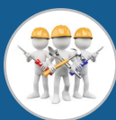
ทีมงานผู้ชำนาญการด้านการติดตั้ง